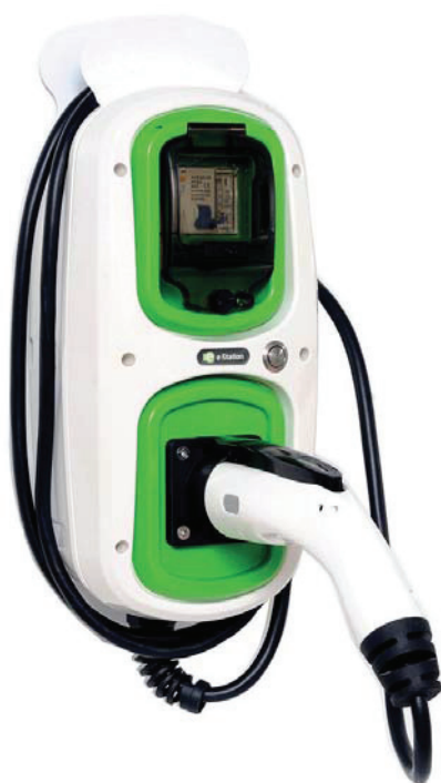
TIPO 1 (Yazaki) SAE J1772-2009