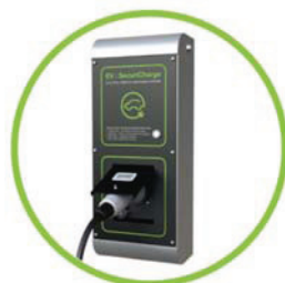
Securi Charger 1x