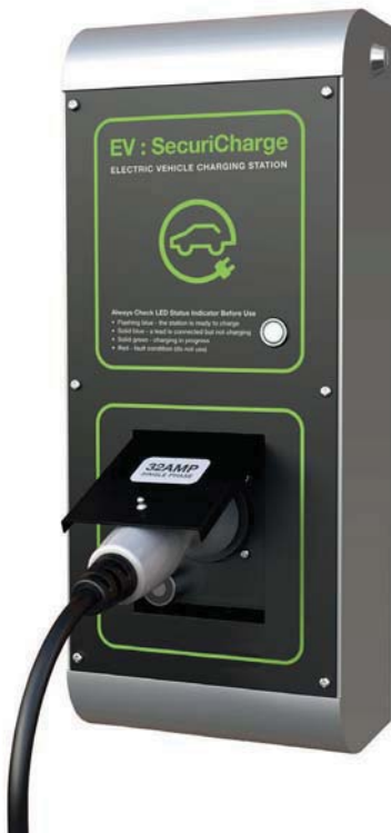
TIPO 2 (Mennekes) VDE-AR-E 2623-2-2

La stazione di ricarica che offre il più alto livello di sicurezza