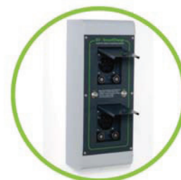
Securi Charger 2x