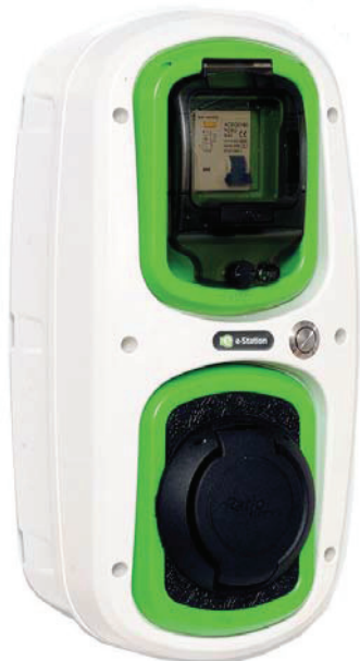
TIPO 2 (Mennekes) VDE-AR-E 2623-2-2